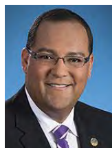
Saul Polo Député de Laval-des-Rapides