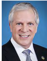
François Paradis Député de Lévis