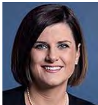
Stéphanie Vallée Ministre de la Justice

Le projet de loi 113 «Loi modifiant le code civil et d'autres dispositions législatives en matière d'adoption et de communication de renseignements» a finalement été adopté et sanctionné le 16 juin 2017. Elle devrait entrer en vigueur au plus tard le 16 juin 2018. Pour les enfants adoptés, ils pourront au moins connaître, un an après le décès de leur mère biologique. Il n'y aura plus de présomption de refus d'accès aux origines et d'accès de contact comme c'est actuellement. Il y aura possibilité d'accéder aux informations sur les origines de la personne concernée si la mère ne s'y est pas opposée. Le père est rarement mentionné dans les dossiers du Centre Jeunesse.