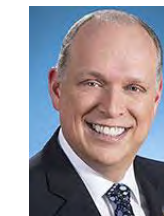
Stéphane Bergeron Député de Verchères