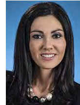
Chantal Soucy Députée de Saint-Hyacinthe