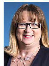
Carole Poirier Députée de Hochelaga- Maisonneuve