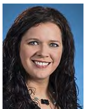
Caroline Simard Députée de Charlevoix – La Côte-de-Beaupré