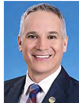
Éric Lefebvre Député d'Arthabaska